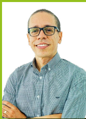
Pr. Fabrício Pacheco Segunda-feira, das 10h às 17h

Agende esse encontro previamente, na Secretaria, permitindo a melhor organização do tempo da equipe em suas atividades cotidianas. Telefone para contato/agendamento: (21) 2599-3000 ou pelo WhatsApp/Telegram: (21) 96811-4842.