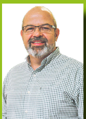
Pr. Purin Jr. Terça-feira, das 14h às 19h